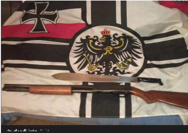
Misanthropic Division: Anhänger der Gruppe präsentieren bei VK ihre Waffen.

Auch die Misanthropic Division verbreitet ihre militante und menschenverachtende Propaganda auf der Plattform. Höhnisch kommentierte Bilder von KZ-Gedenkstättenbesuchen oder antisemitische Memes werden dort eingestellt und die Links dann über populäre Social-Media-Angebote einem breiten Userkreis zugänglich gemacht.